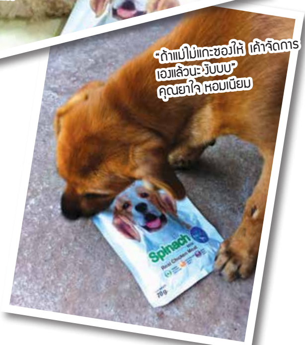
“ถ้าแม่ไม่แกะซองให้ เค้าจัดการเองแล้วนะ ะบบบ” คุณยาใจ หอมเนียม

4 ภาพที่ได้รับคัดเลือกให้ลงฉบับนี้ จะได้รับของที่ระลึกจาก Petlover by Jerhigh ท่านละ 1 เซ็ต