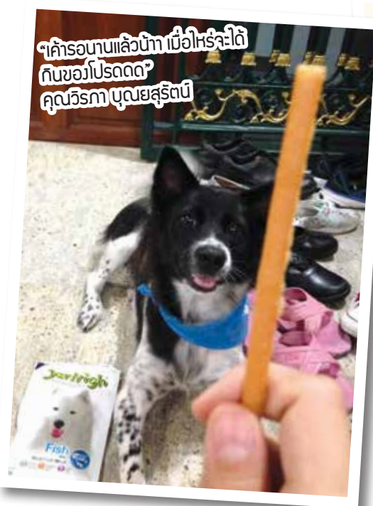
“คำรอนานแล้วบ้าง เมื่อไหร่จะได้กินของโปรดดด” คุณวิรดา บุญยสุรัตน์

กิจกรรมดีๆ สำหรับคนรักน้องสุนัขและชอบเล่นของรางวัล กับการร่วมสนุกง่ายแสนง่าย เพียงเข้าไปกดไลก์แฟนเพจใน FB ของ Pet lover by jerhigh และถ่ายรูปไปเจ้าตูบที่บ้านคู่กับผลิตภัณฑ์เจอร์ไฮ พร้อมเขียนคำบรรยายแล้วส่งมาที่ petloverbyjerhigh@hotmail.com