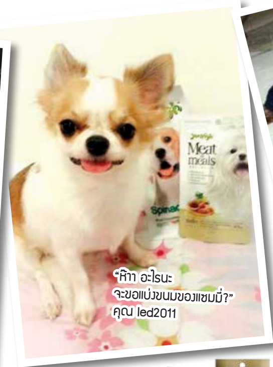
“หิา อะไรนะ จะขอแบ่งขนมของไอ้หมอนี่?” คุณ led2011