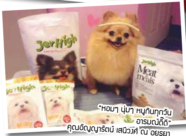
“หอมๆ นุ่มๆ หนูกินทุกวัน อารมณ์ดีดี” คุณอัญญาธรัตน์ เสถียรวิศิณ อัยสุยา

5 ภาพที่ได้รับคัดเลือกให้ลงฉบับนี้ จะได้รับของที่ระลึกจาก Petlover by Jerhigh จำนวน 1 ชิ้น (อย่าลืมติดต่อขอรับของรางวัลด้วยนะคะ)