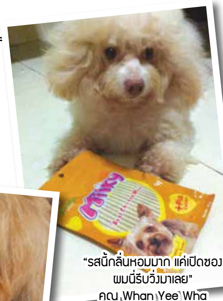
“รสนี้กลิ่นหอมมาก แค่อเปิดขอม ขอมก็รับวิวมาเลย” คุณ Whan Yee Wha