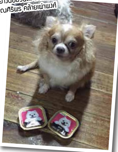
“เจอรี่โฮรสตบนี้..ขอโปรดของผมเลย อย่างน้อยวันละ 2 ถาดครับ” คุณศิริพร คล้ายเพ้าพวดี

กิจกรรมนี้สำหรับคนรักน้องสุนัขและชอบเล่นของรางวัล กับการร่วมสนุกง่ายแสนง่าย เพียงเข้าไปกดไลก์แฟนเพจใน FB ของ Pet lover by jerhigh และถ่ายรูปเจ้าตูบที่บ้านคู่กับผลิตภัณฑ์เจอรี่โฮ พร้อมเขียนคำบรรยายแล้วส่งมาที่ petloverbyjerhigh@hotmail.com