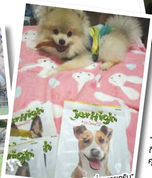
“Jerhigh สลิกี่อร่อยที่สุดเลยครับ” คุณ Chosita Kongkittingam