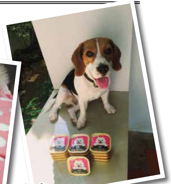
“แม่บอกให้หนูกำหน้าตาให้น่ารักก่อน ก็จะได้หน้า Jerhigh หน้ายิ้มอำปากหลับตา” คุณ Mommam

4 ท่านที่ภาพได้รับเลือกให้ลงฉบับนี้ จะได้รับของที่ระลึกจาก Petlover by Jerhigh ท่านละ 1 ชิ้น (อย่าลืมติดต่อขอรับของรางวัลด้วยนะคะ)