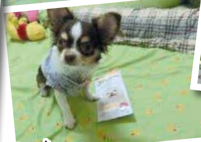
“ผมขี้ขี้เลยยย+ แค่นี้ขอ ของขี้ขี้ก็พอใจ ไม่ไหวแล้วครับ” คุณ norneanoi nornean