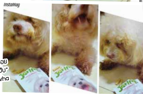
“ออร์ออร์ ออร์ออร์ จมหยุดไม่ได้เลยฮับ” คุณ whanyeeeha

สำหรับ 5 ท่านที่ได้รับคัดเลือก ให้ลงภาพในฉบับนี้ จะได้รับของที่ระลึก จาก Petlover by Jerhigh ท่านละ 1 ชิ้น