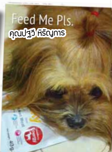
Feed Me Pls. คุณปวีร์ ศิริคุณาร