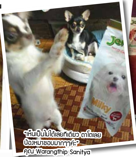
“เห็นเป็นไม่ได้เลยก็เดียว ตาโตเลย บ๊องหมาชอบมากๆค่ะ” คุณ Warangthip Sanitya