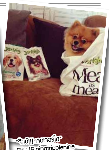
“จอร์จ!!! จอร์จจอร์จ”