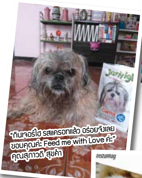
“กินจอร์จ สดแครอกแล้ว อร่อยจริงเลย ชอบคุณจอร์จ Feed me with Love ค่ะ” คุณสุภาวดี สุขคำ

กิจกรรมดีๆ สำหรับคนรักน้องสุนัขและชอบสุนัขของรางวัล กับการร่วมสนุกถ่ายแสบถ่าย เพียงเข้าไปกดไลก์แฟนเพจใน FB ของ Pet lover by jerhigh และถ่ายรูปเจ้าตูบที่บ้านคู่กับผลิตภัณฑ์จอร์จ พร้อมเขียนบรรยาย แล้วส่งมาที่ petloverbyjerhigh@hotmail.com