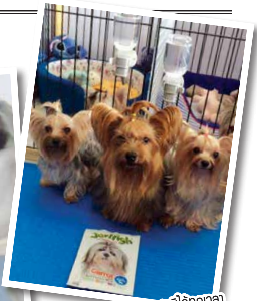
“ความสุขมีได้ทุกเวลา กับ เจอร์ไฮ” คุณ lee sp