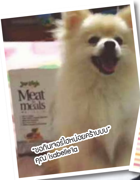
“ขอกินเจอร์ไฮหน่อยคร้าบบบ” คุณ Isabelle'a

กิจกรรมดีๆ สำหรับคนรักน้องสุนัขและชอบสุนัขของรางวัล ด้วยการร่วมสนุกง่ายแสนง่าย เพียงเข้าไปกดไลก์แฟนเพจใน FB ของ Pet lover by jerhigh และถ่ายรูปไปจับคู่ที่บ้านคู่กับผลิตภัณฑ์เจอร์ไฮ พร้อมเขียนคำบรรยายแล้วส่งมาที่ petloverbyjerhigh@hotmail.com