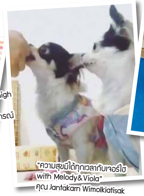
“ความสุขมีได้ทุกเวลากับเจอร์ไฮ with Melody & Viola” คุณ Jantakam Wimolkiatissak