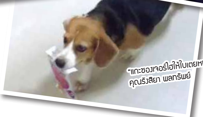
“แกะซองเจอร์ไฮให้ใบเตยหน่อย” คุณรั้วสิยา พลกรัณย์

5 ภาพที่ได้รับคัดเลือกให้ลงฉบับนี้ จะได้รับของที่ระลึกจาก Petlover by Jerhigh ท่านละ 1 ชิ้น (อย่าลืมติดต่อขอรับของรางวัลด้วยนะคะ)