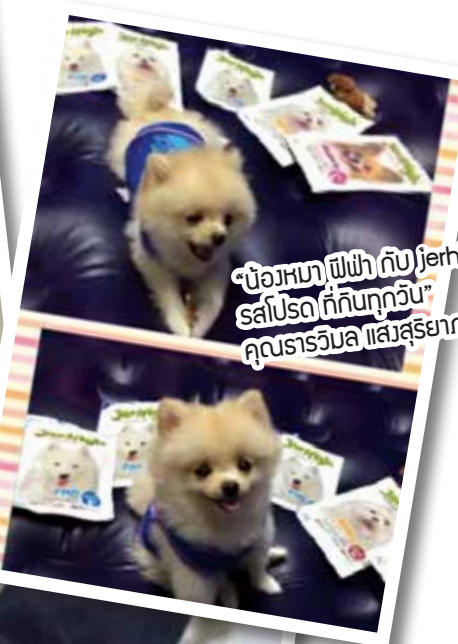
“บ๊องหมา ฟีฟ่า กับ Jerhigh สลัปโปรด ที่กินทุกวัน” คุณธารวิมล เสือสุริยากรณิ