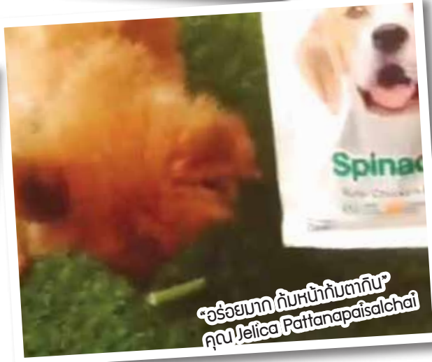
“อร่อยมาก กับหนังกีบตากับ” คุณ Jelicca Pattanapaisalchai