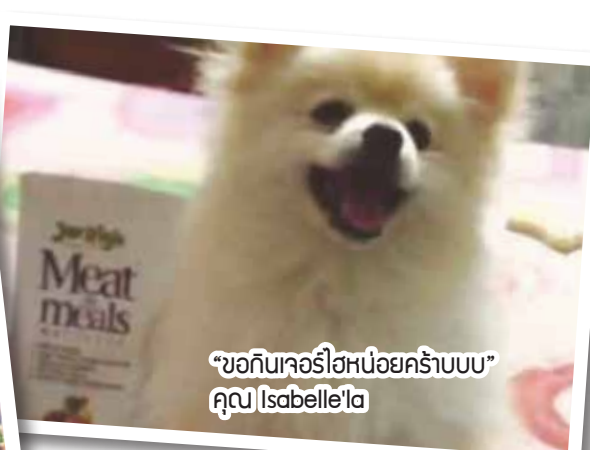
“ขอกินเจอรี่ไฮหน่อยคร่าบบบ” คุณ Isabelle'la