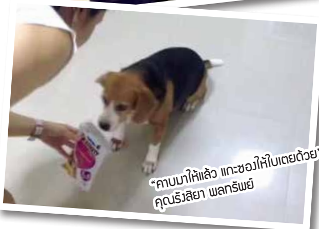
“คาบมาให้แล้ว แทะขอให้ใบเตยด้วย” คุณรังริยา พลกรัณย์