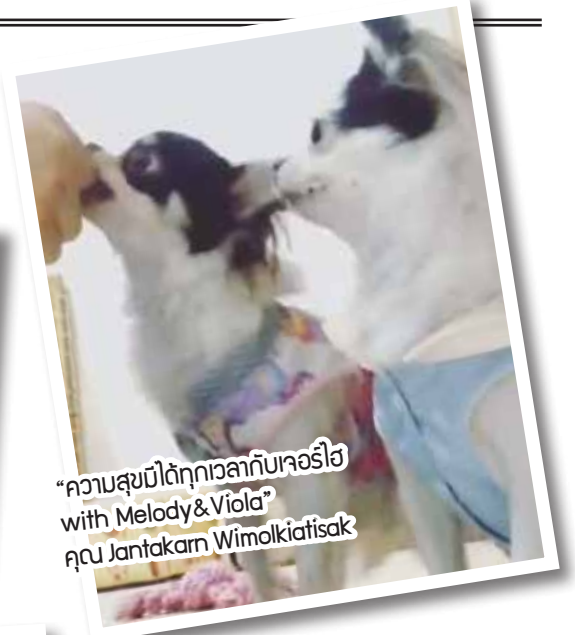
“ความสุขได้ตลอดเวลาไปกับเจอรี่ไฮ with Melody&Viola” คุณ Jantakarn Wimolkiattisak