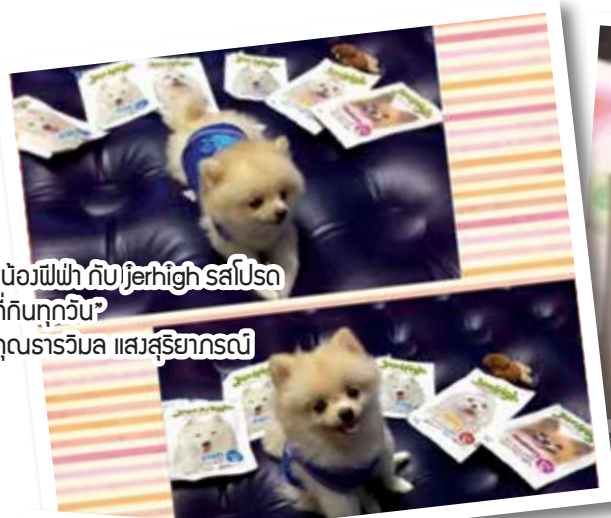
“บ๊อว์ฟีฟ่า กับ Jerhigh สดใสปกที่กันทุกวิน” คุณธารวิมล แสงสุริยากรณ์

กิจกรรมดีๆ สำหรับคนรักน้องสุนัขและขอบุณของรางวัล กับการร่วมสนุกง่ายแสนง่าย เพียงเข้าไปกดไลก์แฟนเพจใน FB ของ Pet lover by jerhigh และถ่ายรูปไปจับคู่ที่บ้านคู่กับผลิตภัณฑ์เจอรี่ไฮ พร้อมเขียนคำบรรยายแล้วส่งมาที่ petloverbyjerhigh@hotmail.com