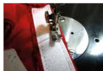
6. นำเทปตีนตุ๊กแกเย็บติดตามความยาวของสายเสื้อทั้งสองด้าน เล็มเก็บเศษด้าย นำไปแต่งองค์ให้ซานต้าตอกได้แล้ว