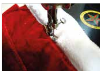
4. นำผ้าขนแกะสีขาวส่วนชายเสื้อเย็บเก็บขอบชายเสื้อชิ้นหลัง