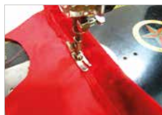
2. นำชิ้นสายเสื้อมาเย็บประกบเข้ากับเสื้อส่วนหน้าทั้ง 2 ชิ้น (ชาย-ขวา)