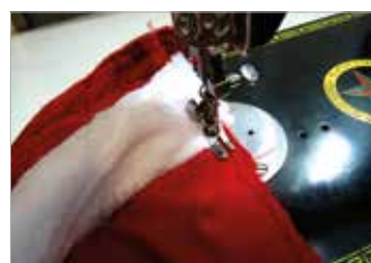
5. เย็บชิ้นหมวกด้านบนติดกัน แล้วเก็บขอบด้วยผ้าขนแกะรอบด้าน จึงเย็บตัวหมวกส่วนหลังติดกัน แล้วนำชิ้นหมวกเย็บติดกับส่วนคอเสื้อไปจนถึงไหล่