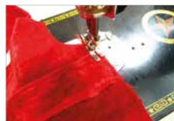
3. ซึ้นเข็มขัดเย็บประกบเก็บขอบโดยรอบ แล้วเย็บติดเข้าข้างเสื้อส่วนหลังด้านซ้ายขวา จากนั้นนำเสื้อส่วนหน้ามาประกบแล้วเย็บด้านข้างและหัวไหล่เข้าด้วยกัน