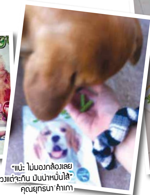
“แป๊ะ ไม่บอวงล่องเลย หวังแต่จะกิน มันน่าหมั่นไส้” คุณยุกรณา คำเกา