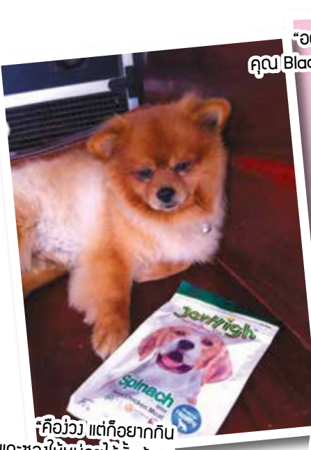
“คืออ้วว แต่ก็อยากกิน แกะซองให้หน้อยได้บัยค้าบ” คุณเสร์ ปิตกา

กิจกรรมดีๆ สำหรับคนรักน้องสุนัขและชอบสุนัขของรางวัล กับการร่วมสนุกง่ายแสนง่าย เพียงเข้าไปกดไลก์แฟนเพจใน FB ของ Pet lover by jerhigh และถ่ายรูปเจ้าตูบที่บ้านคู่กับผลิตภัณฑ์จอร์ไฮ้ พร้อมเขียนบรรยาย แล้วส่งมาที่ petloverbyjerhigh@hotmail.com