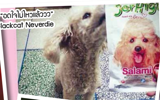
“อดใจไม่ไหวแล้วว” คุณ Blackcat Neverdie