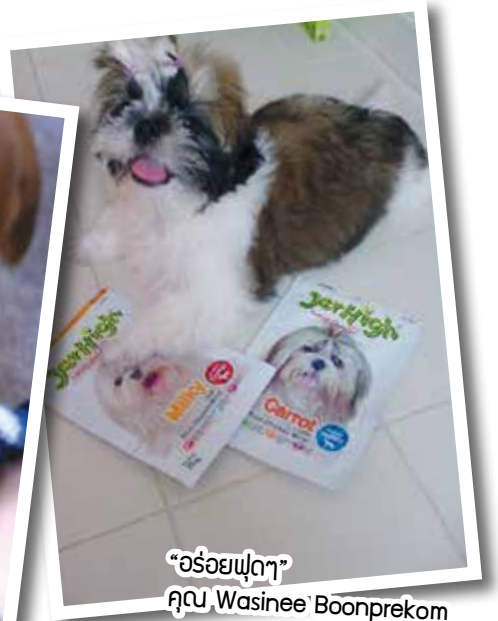
“อรรอยปุ๊ตๆ” คุณ Wasinee Boonprekom

5 ภาพที่ได้รับ คัดเลือกให้ลงฉบับนี้ จะได้รับของที่ระลึก จาก Petlover by Jerhigh ท่านละ 1 ชิ้น