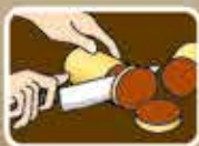
2. หั่นเป็นชิ้นเล็กๆ