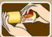
1. ถอดฝาออก

เจอร์ไฮ ฮอตดอกบาร์... อร่อยง่าย ๆ ได้คุณค่าเนื้อแท้