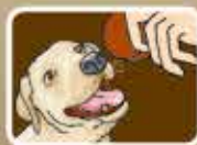
4. ให้สุนัขรับประทานได้ทันที