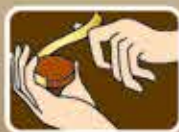
3. ผสมเข้าอาหาร