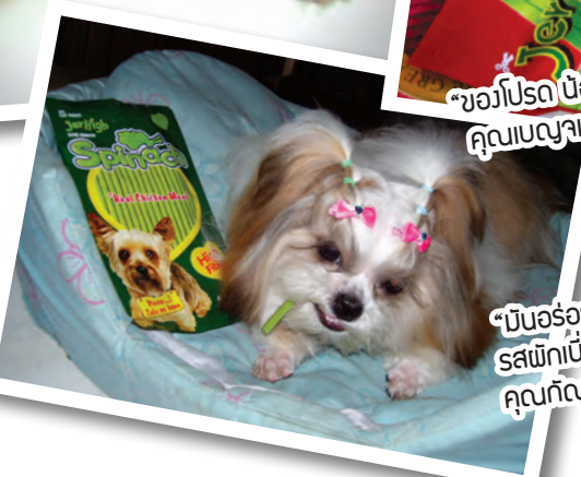
“บินอ้อย จิง จิง รสพิ๊กเบ๊ย ว่า ว่าจะว่า” คุณกัญญาภัค ขำวิริส”

สำหรับ 5 ท่านที่ได้รับคัดเลือกให้ลงภาพในฉบับนี้ จะได้รับของที่ระลึกจาก Petlover by Jerhigh ท่านละ 1 ชิ้น