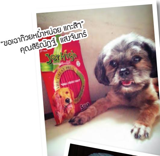
“ขอฝากด้วยหน้าหน่อย แกะสีๆ คุณสิริณัฐรี แสงวิจิตร”

กิจกรรมดีๆ สำหรับคนรักน้องสุนัขและชอบสุนัขของรางวัล กับการร่วมสนุกง่ายแสนง่าย เพียงเข้าไปกดไลก์แฟนเพจใน FB ของ Pet lover by jerhigh และถ่ายรูปเจ้าตูบที่บ้านคู่กับผลิตภัณฑ์ Jerhigh พร้อมเขียนบรรยาย แล้วส่งมาที่ petloverbyjerhigh@hotmail.com