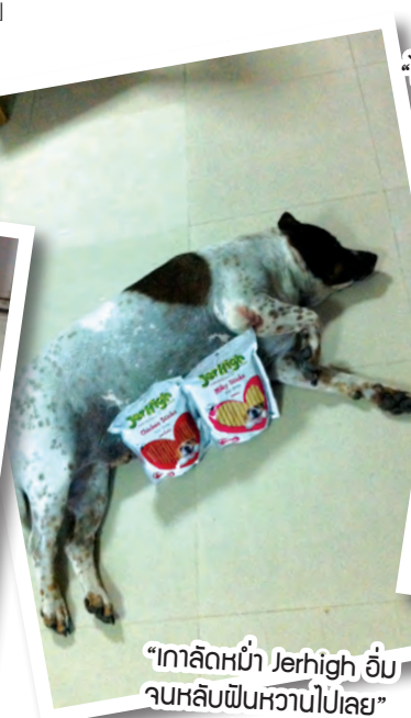
“กาลัดหน้า Jerhigh อับจบหลับฝันหวานไปเลย” คุณณัฐภี สะอาดโอบขจร”