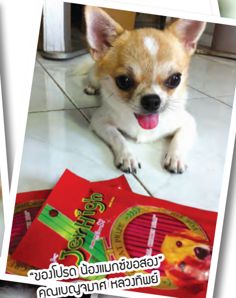
“ขอโปรด น้องแมกซ์ขอสงวน” คุณเบญจมาศ หลวงทิพย์”