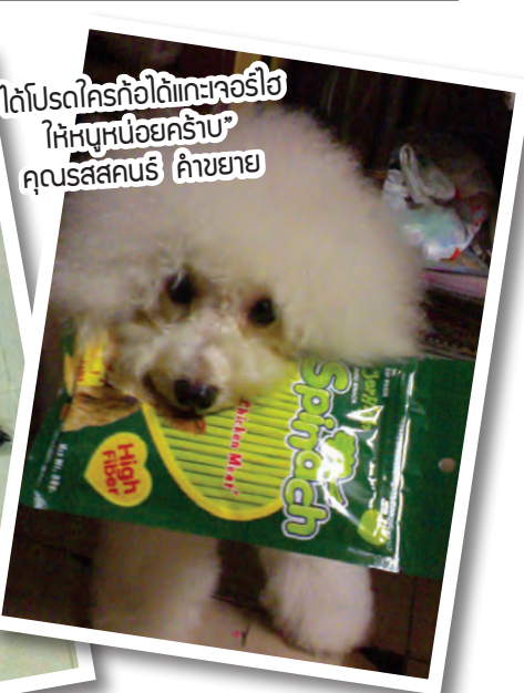
“ได้โปรดใครถือได้แคะจอร์ฮิ ให้หนูหน่อยคร๊าบ” คุณรสสนธิ์ คำขยาย”