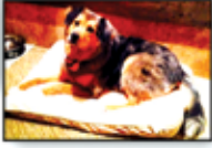
Brown/Gray, Aussie mix, 11-yr. boy.