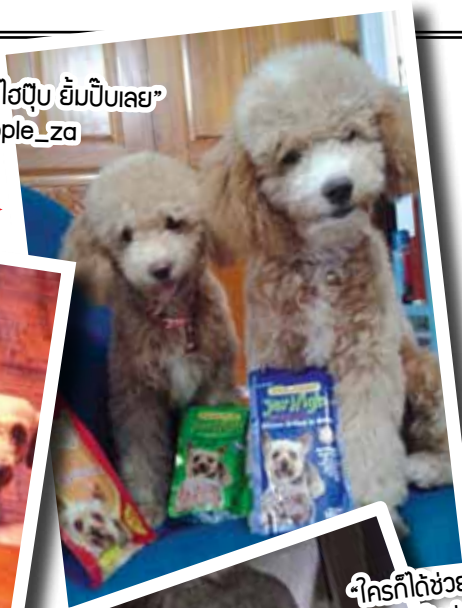
“ใครก็ได้ช่วยแกะห่อให้ที หนูสิแล้วค่ะ” คุณ Poppy Okus